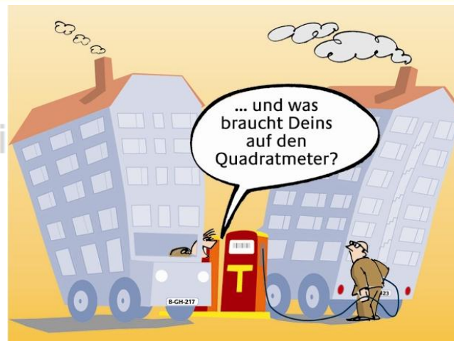
Entwurf: Martin Göller – Nachdruck und Vervielfältigung nur mit schriftlicher Genehmigung